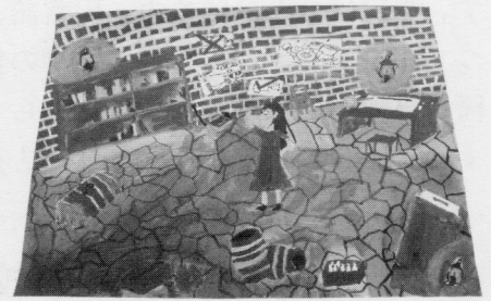
6年 奥山 賢宇 『マッティの秘密基地』