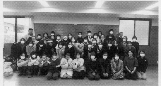
スタッフ・ボランティアの皆さん

オープンは11時ですが、10時20分にはすでに多くの方が並んでいて整理券を配布。今日のメニューがちらし寿司であることとクリスマス前で絵本の配布などあることが人気のようです。台所とお弁当盛り付けの部屋は大忙し、息もつかないほどで、学生さんは野菜の仕分け・袋詰めなどベテランの主婦の指示でキビキビ、テキパキ。時間になり来られた親子連れ、お年寄りの方々は、手に持ちきれないほどの食品とお手伝いの方々の温かい気持ちに満面の笑顔で家路につかれました。