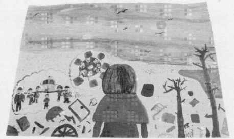
5年 明石 一知葉 『夕焼けにうつる思い出』